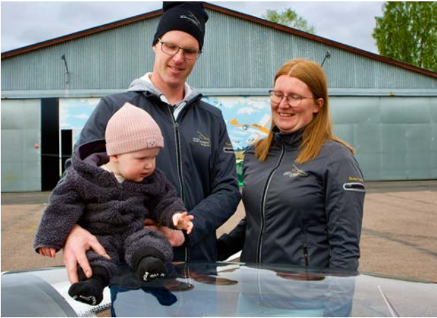
Hela familjen trivs på flygfältet.

nu när pandemin verkar vara över, säger han. Han tävlar också i konstflyg och hittills har det blivit två VM-guld och många medaljer i andra valörer, bland annat i EM och NM.