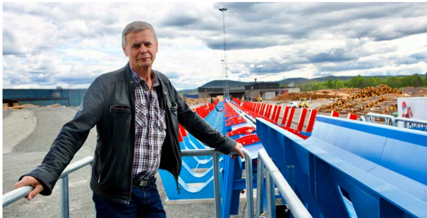
På Sveden trä i Äppelbo investeras också i en timmersorteringsanläggning.

B URNBLOCK BLEV ETT världspatent 2014, och sedan dess har Per-Erik intresserat haft ögonen på det. Det är ett flytande brandskydd baserat på salt. När Per-Erik kom i kontakt med det danska företaget och de började prata visade det sig att det är precis typen av företag som Sveden Trä som Burnblock vill jobba tillsammans med.