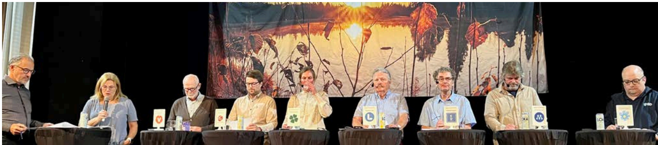
Politikerutfrågningen i Vansbro den 1 september dominerades av bostadsfrågan.