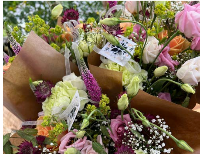
Blommigt och hantverk är höstens trend.

– Det är faktiskt jättekrångligt, men jag tror att jag har en lösning på gång nu, säger hon.